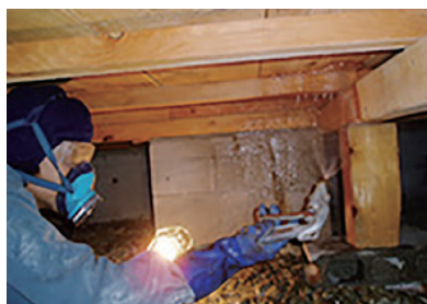
隅々まで薬剤を散布していきます