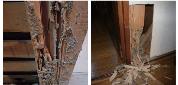
白アリ被害を受けた柱