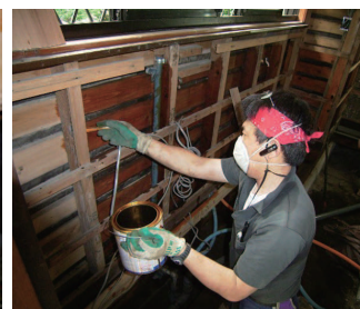
工事中なら壁面へも塗布