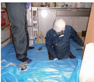
点検穴や和室から入ります

白アリ消毒工事の依頼は、白アリが出た後にご連絡頂くのが最も多くなります。しかし、家の中で白アリの痕跡を見つけた時には、すでにかかなりのダメージを負っている状態です。また、白アリ消毒工事は、殺虫効果よりも防虫効果の方が高く、言い換えれば「白アリを寄せ付けなくする工事」です。長く大切に住み続けたい家だからこそ、早めの消毒が大切になります。