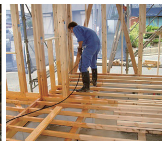
工事中はよりくまなく処理